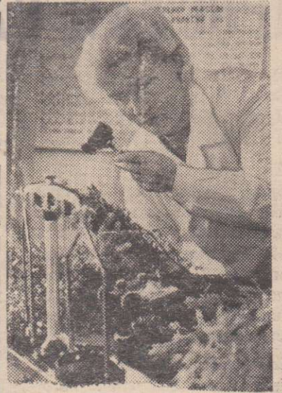
НАУКА — СЕЛЬСКОМУ

Об этом рассказывается в экспозиции павильона «Ветеринария» на ВДНХ СССР, где сейчас проходит смотр хирургических инструментов и лабораторного оборудования в ветеринарии.